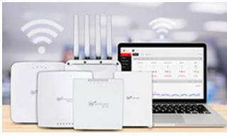
Wi-Fi Seguro en la Nube