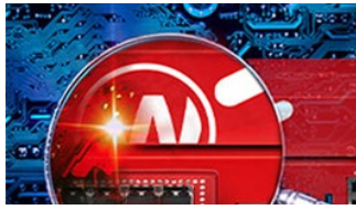
Seguridad de Red